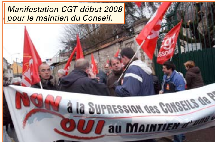
Manifestation CGT début 2008 pour le maintien du Conseil.