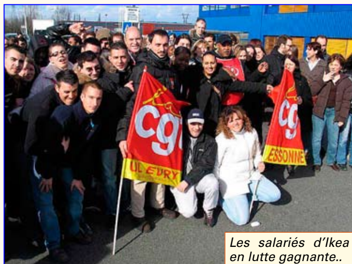
Les salariés d'Ikea en lutte gagnante..

tégrés et préfèrent recevoir des indemnités de rupture. La section Commerce traite aussi des licenciements pour inaptitude et là encore, certains employeurs se